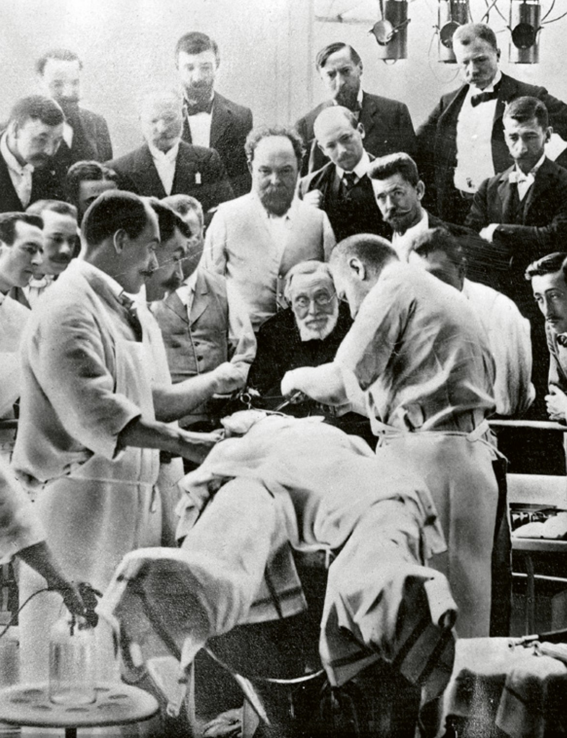
FACULTÉ DES SCIENCES ET DE MÉDECINE MATHEMATISCH-NATURWISSENSCHAFTLICHE UND MEDIZINISCHE FAKULTÄT CHEMIN DU MUSÉE 18, CH-1700 FRIBOURG